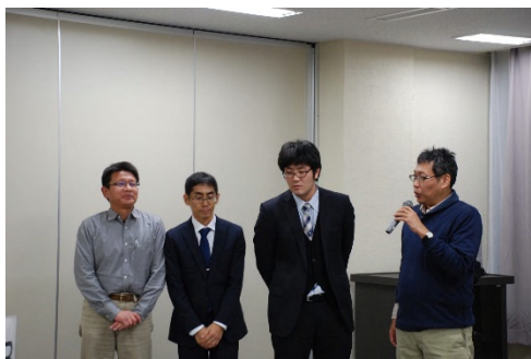
写真3 Aグループの発表