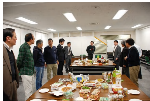
写真 8 情報交流会

情報交流会において、修習技術者支援委員会委員、委員補佐、参加者等が講演やグループワークの内容などを踏まえた活発な意見交換をした。また、今後の修習活動に向けても、積極的な情報交換を行った。