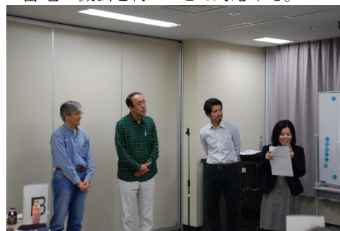
写真4 Bグループの発表