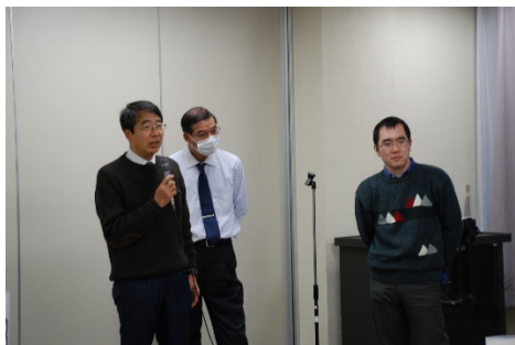
写真2 Cグループの発表