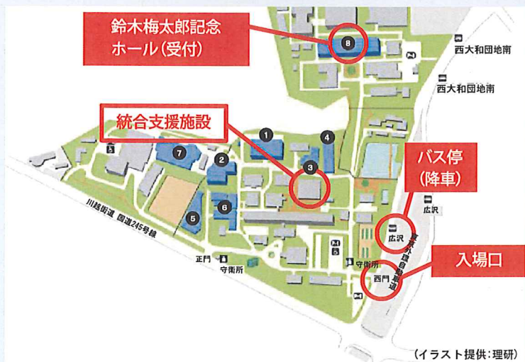
(イラスト提供: 理研)