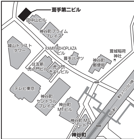
日本技術士会荻手第二ビル 東京メトロ日比谷線「神谷町」徒歩3分