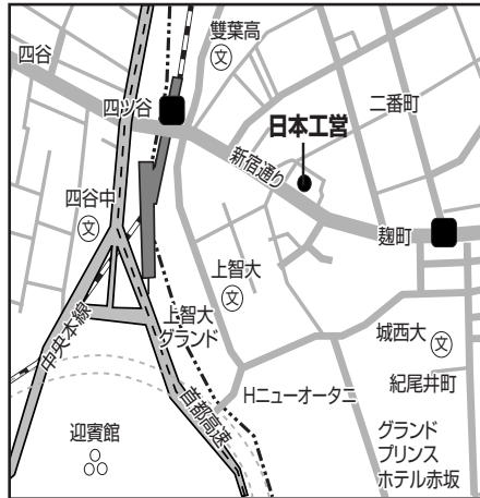
日本工営本社 JR中央線・東京メトロ「四ツ谷」徒歩6分