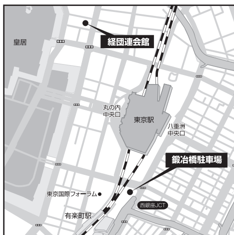
JR東京駅 八重洲中央口より徒歩5分