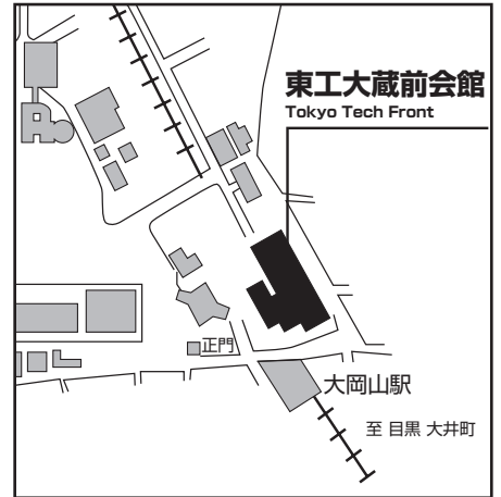
東工大蔵前会館 Tokyo Tech Front 東急 大井町線・目黒線「大岡山」徒歩1分