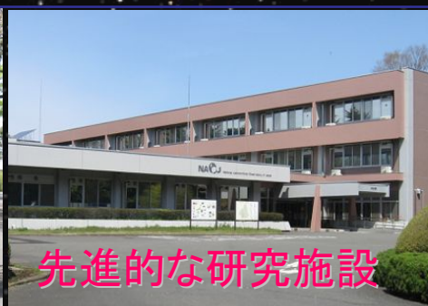
先進的な研究施設