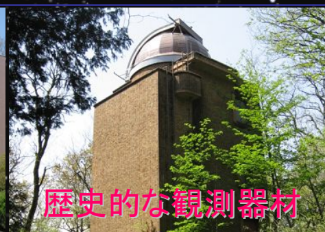
歴史的な観測器材