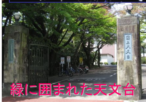
緑に囲まれた天文台