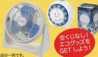
※写真は賞品の一例です。