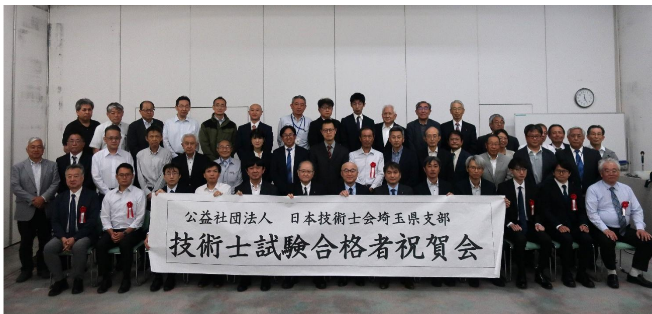
集合写真(祝賀会参加者一同)