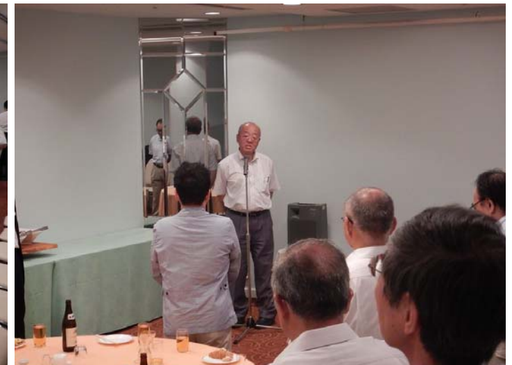
締め挨拶(牧垣副支部長)