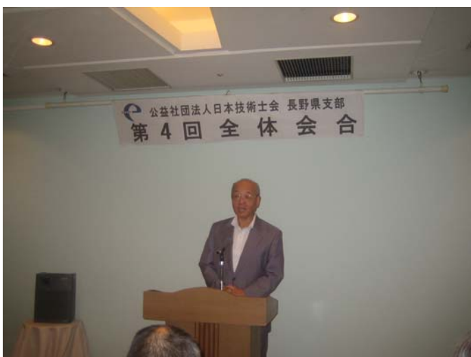
開会の辞(牧垣副支部長)