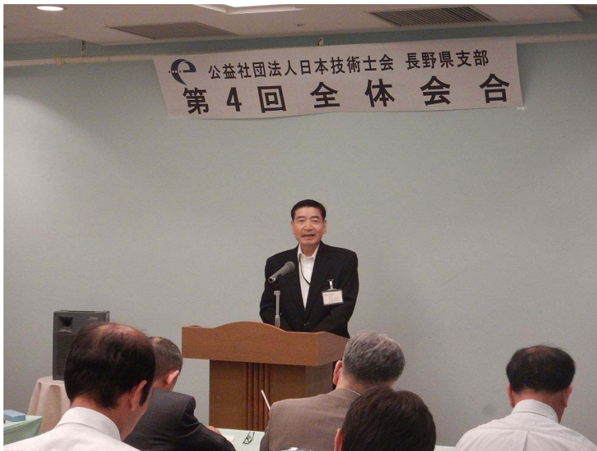
有賀支部長の挨拶