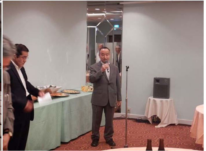
小口新支部長挨拶