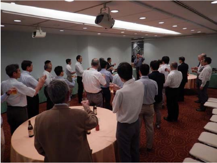
乾杯(平林事務局長)