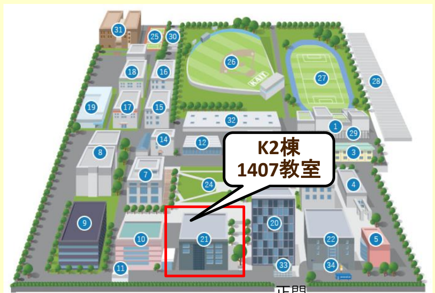
キャンパスマップ