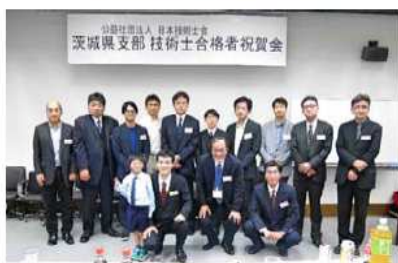
合格者全員での記念撮影