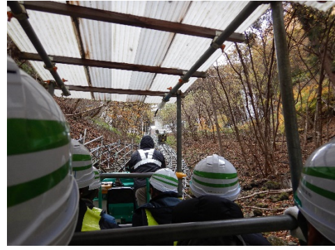
■モノレール。急斜面のぼっているんです。