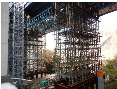
■仮設がすごいことになってます