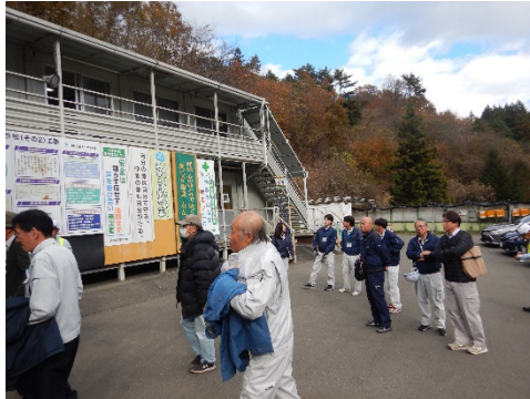
■まずはテクノセンターへ