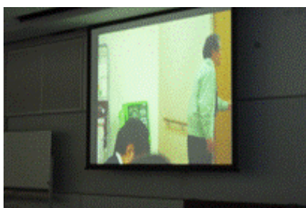
「映像で知る情報セキュリティ」 https://www.ipa.go.jp/security/keihatsu/videos/ わかりやすい動画でみると説得力あります。