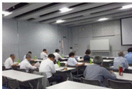
真剣に聞く、参加者の方々。 普段、なかなか聞けない情報です。 リスク管理も見直しが必要ですね。