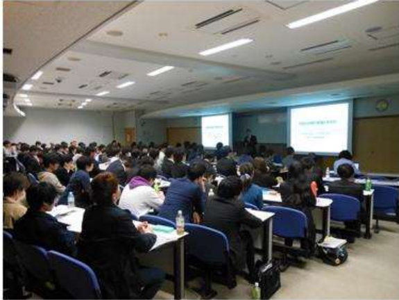
2017.4 大学生への 技術士説明会

同じ原子力・放射線部門でも 選択分野の異なる人と出会う 機会を通じ、より多面的に検 討する機会が増えた。