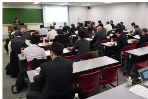
部会主催の講演会

CPD講座など、自己 研鑽のきっかけと継 続研鑽に参加し易く なり更なるコンピテ ンシーの向上を図る ことができた。