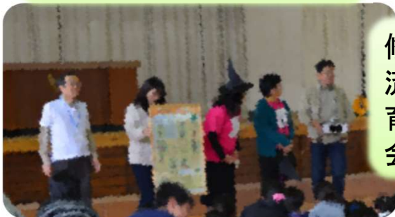
2016.11 茨城県内小学校 学校での理科体験協力 茨城県技術士会他

部の役員・幹事とし て関わる事によって、 技術士のあるべき姿 への理解が深まった。