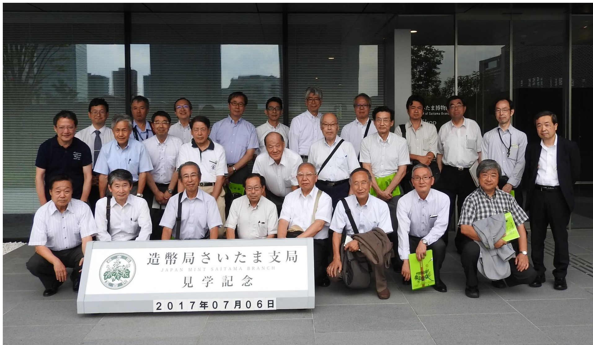
日本技術士会 経営工学部会 7月見学会（於 造幣局さいたま支局）