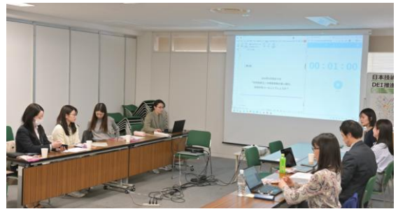
第69回技術サロンの様子 (リアル開催)

技術士資格を持っていることで様々なメリットがありますが、特に、結婚や出産等のライフイベントで環境や働き方が変わる人にとって技術士資格は強い味方となるといえます。