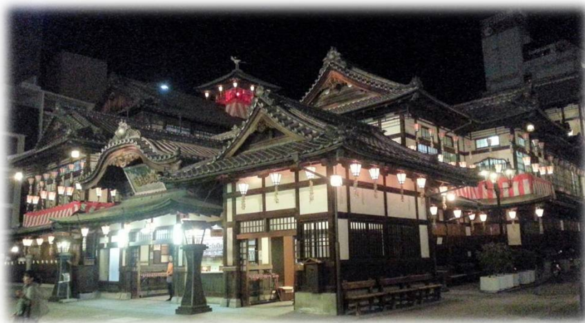
道後温泉本館 1894年に建築され、2014年に 築後120年を迎えます