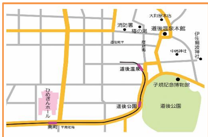
道後温泉と会場周辺地図