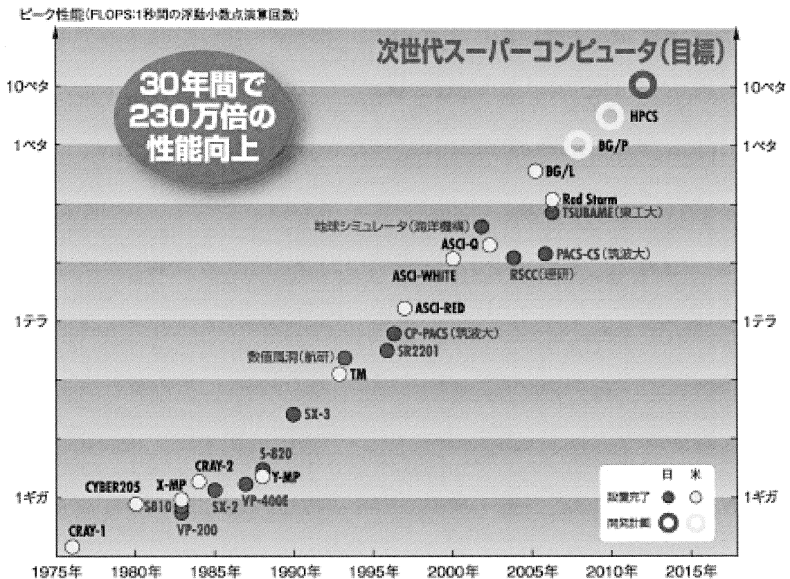
図1 スーパーコンピュータの性能推移