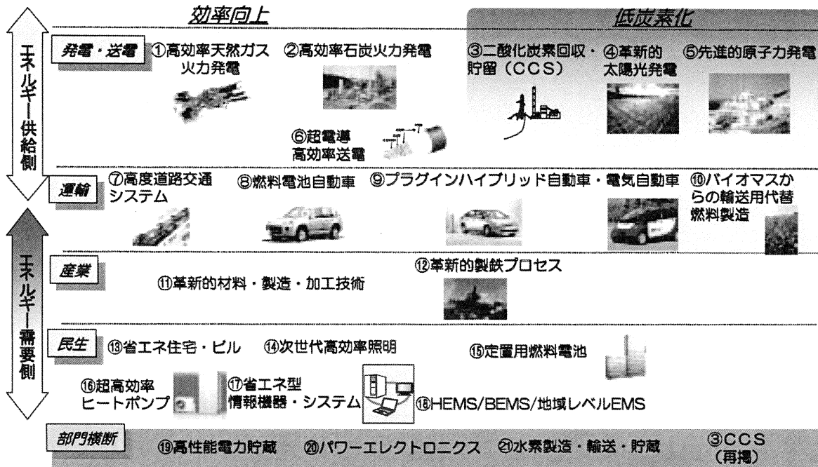
図1 重点的に取り組むべき21のエネルギー革新技術