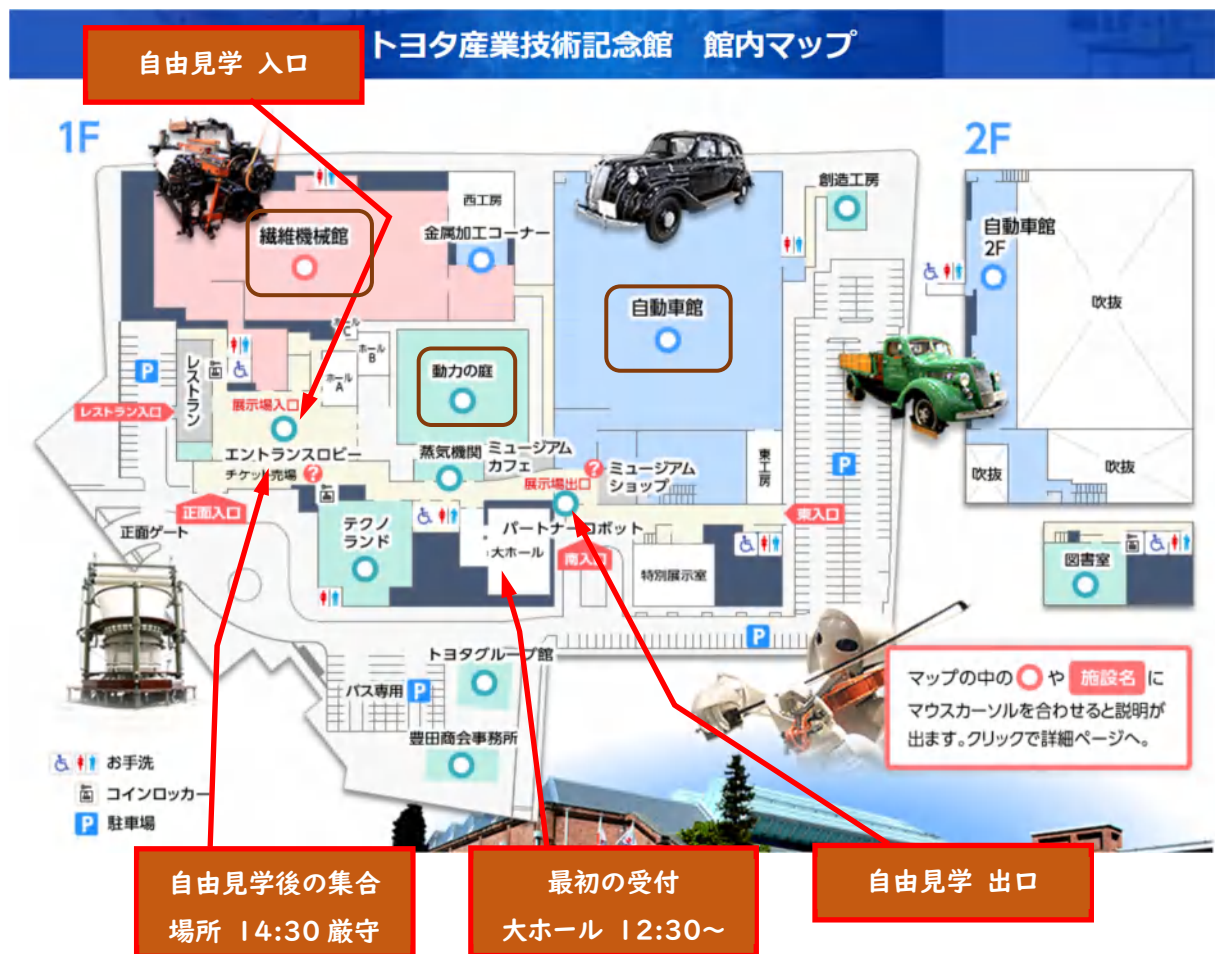
[出典] トヨタ産業技術記念館 HP