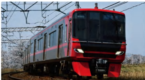
[タイトル] 『新しい顔』