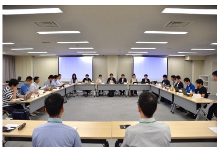
拡大委員会の様子

2日目のテクノツアーでは 機械振興会館の隣にある東京タワーをテーマに設定し、冒頭に講義として東京タワーの素材や設計、維持管理、耐震補強工事、設計者のエピソード等を説明し、その後、東京タワーの外階段でメインデッキまで上るイベントを実施しました。階段を登る最中にも、講義内容に関する話題が参加者から出るなど、気づきの多い有意義なテクノツアーとなりました。