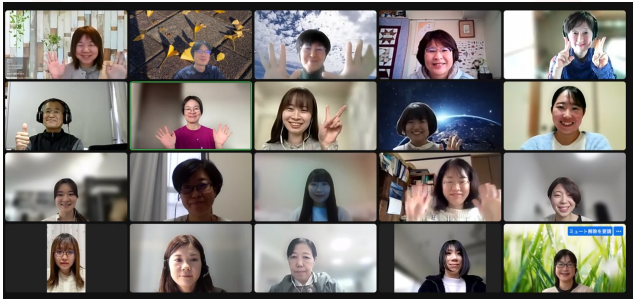
第60回技術サロンの参加者

技術士資格を持っていることで様々なメリットがありますが、特に、結婚や出産等のライフイベントで環境や働き方が変わる女性にとって技術士資格は強い味方となるといえます。